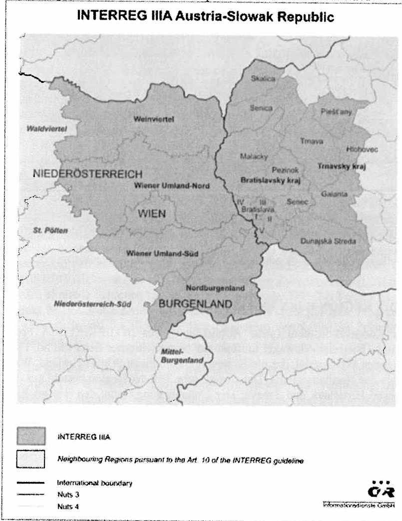
Abbildung 4: Der INTERREG Kooperationsraum Wien-Bratislava